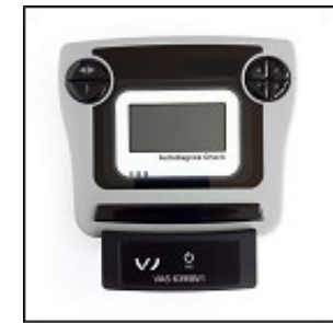
Abb. 4: VDO VAS 6395B* (Abbildung ähnlich)