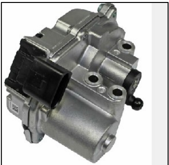
Abb. 1: Stellelement Drallklappen

Je nach Fehlerursache können einzelne Komponenten oder das ganze Saugrohr ersetzt werden.