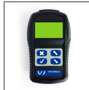
Abb. 3: VDO VAS 6395A* (Abbildung ähnlich)

Das Anlernen ist ausschließlich mit folgenden VDO Spezialgeräten (aktueller Softwarestand zwingend erforderlich) möglich!